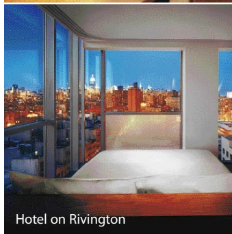
Hotel on Rivington